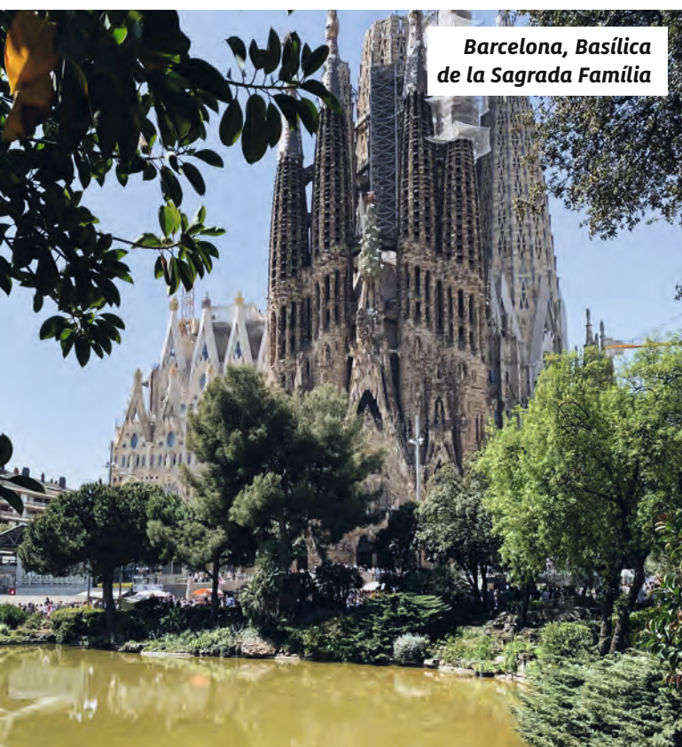
Barcelona, Basílica de la Sagrada Família

Palma de Mallorca genießen. Weiter geht es in die pulsierende Metropole Barcelona, wo Kultur, Architektur und Lebensfreude aufeinandertreffen. Anschließend führt Sie die Kreuzfahrt in das glamouröse Cannes an der Côte d'Azur – bekannt für Filmfestspiele, Luxus und französisches Flair. Schließlich kehren Sie nach Genua zurück, erfüllt von neuen Eindrücken, kulinarischen Genüssen und dem unverwechselbaren Zauber des Meeres.